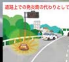
道路上での発炎筒の代わりとして